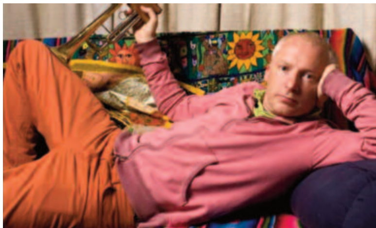
Marcus du Santoy

És hogy egy kis sajnálatot is érezzünk, Sautoy szeniálisan bele-szó egy életrajzi adatot is értekezletébe. Riemann házvezetőnője mindig rosszállóan tekintett a sok papírra, amely a tudóst körülvette, de tilos volt neki bármihez is hozzányúlania. Igen ám, de amikor Riemann tüdővészben elhalálozott, a buzgó hölgy egykettőre rendet teremtett a kaoszban. Ennek a rendteremtésnek az lett az eredménye, hogy több feljegyzés hétköznapi, nemes cél szolgálatába lépett, vagyis tűzgyújtóként fejezte be létét. Ami mégis megmenekült a tűzhálaltól, azokból kiderült, hogy Riemann sokkal több dolgot bebizonyított, mint amennyit köz-zétett. Egy papírlapon még ott volt a feljegyzés, hogy bebizonyított valamit a prímekek kapcsolatban, de a bizonyítás még nem érett meg a publikációra. Sajnos, a bizonyítást tartalmazó lapok valószínűleg a házvezető hölgy tevékenységének estek áldozatául.