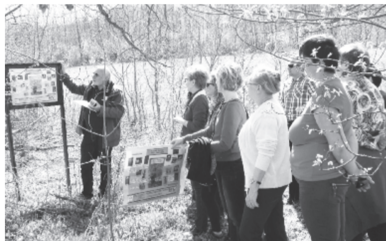
Az adorjáni tanösvényeken nagyon jól tanulmányozhatók a természet leckéi

Ezután a három iskola mutatta be, hogyan sikerült a diákjaikkal kipróbálni az új módszereket. Gálfalva községben négy pedagógus 24 diákkal dolgozott, az ismeretfelmérés után a természettel ismerkedtek, meglátogattak egy-egy helyi fafaragót és fafeldolgozó műhelyt, egy világvilágkávészóznak nevezett ötletbörzét tartottak, meglátogatták a szentábrahámi (Harghita megye) teafarmot, majd üzleti tervet készítettek laskagomba termesztésére, erdei gyümölcsök begyűjtésére, amit gyorsfagyasztva értékesítenének, továbbá földlabdás tölgyecseméteket termesztene. A szeredai középiskolában öt tanár 58 diákkal dolgozott: ismertető volt a természet