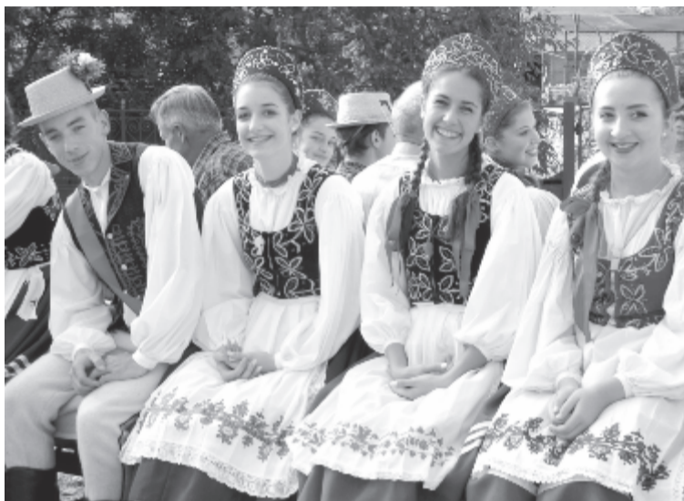
Hagyományőrző és kulturális tevékenységekre, de sport- és ifjúsági programokra is lehet támogatást igényelni

Egyre több településen nyújtanak vissza nem térítendő támogatást az önkormányzatok a nemkormányzati szervezeteknek – lassan szinte mindenhol rájönnek, hogy egyes feladatokat hatékonyabban és lelkesebben el tudnak látni a civilek, mint a sokszor emberi erőforrásban is szűkölködő önkormányzat. Ráadásul az állami számvevőszék is szigorúbb feltételek betartására szorítja a közintézményeket, így esetenként egy nemkormányzati szervezet kevesebb megkötéssel, eredményesebben tud egyes tevékenységeket megszervezni, lebonyolítani.